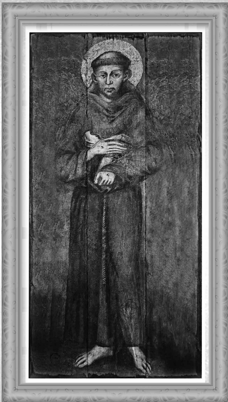
San Francisco de Asís, pintura al óleo