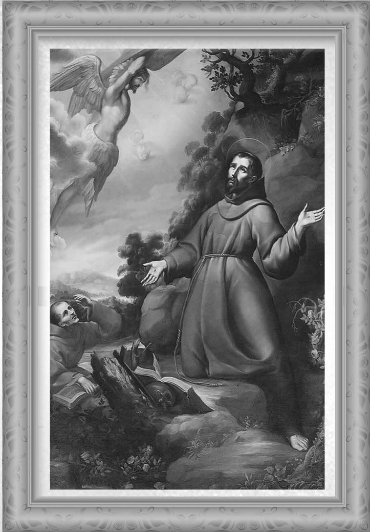
San Francisco recibiendo los estigmas