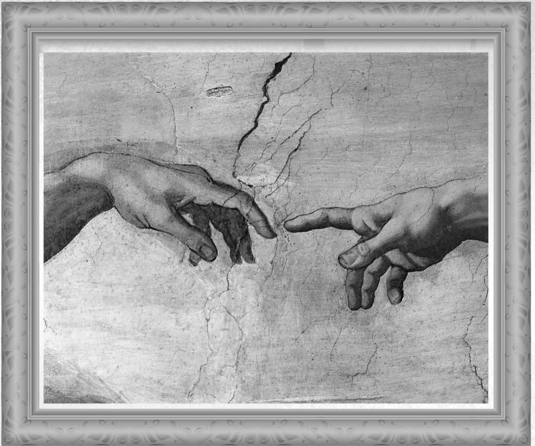
La creación de Adán