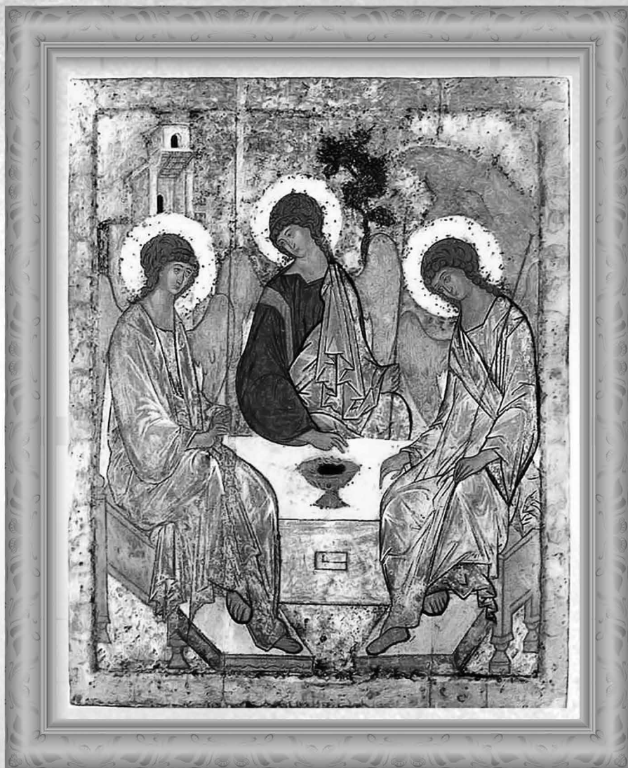
San Francisco de Asís, por Cimabue